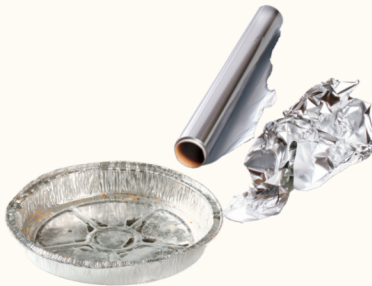
El Papel de Aluminio y Placas Circulares de Aluminio