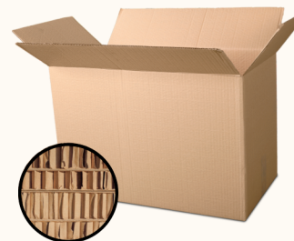
Cartón Corrugado y Papel Café