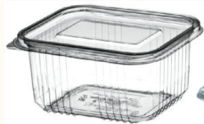
Recipientes de comida de plástico, incluso si indican un #1 o #2