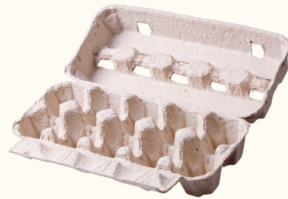
Cartones de huevos