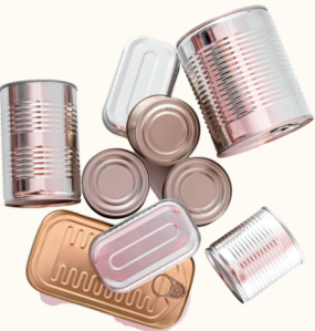
Latas de Comida de Acero