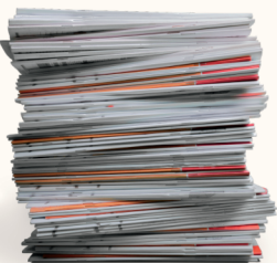
Papel de Oficina