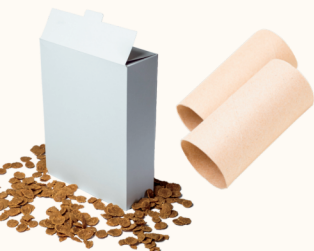
Cartón (por ejemplo, envases de cereales)