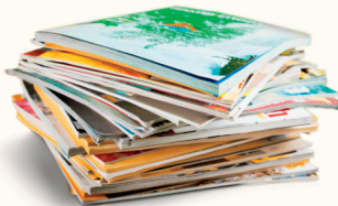
Revistas y Catálogos