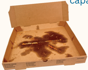
Cartón con restos de alimentos

Por favor NO incluya estos elementos con el reciclaje. Muchos de ellos tienen baja capacidad de reciclaje y son, por lo tanto, difíciles de distribuir al mercado. Sugerimos que elijan envases alternativos cuando sea posible..