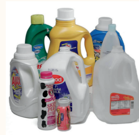
Botellas de Plástico #2 sin tapas