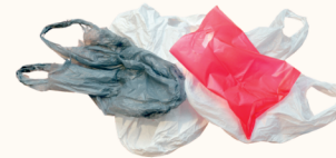
Bolsas y Envuelto de Plástico