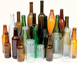
Botellas y Frascos de Vidrio