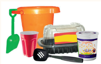
Plásticos de número 3 a 7