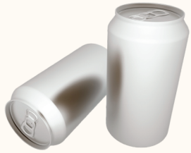
Latas de Aluminio